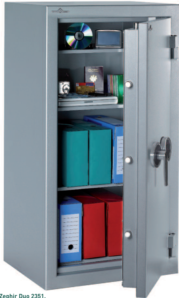
Zephir Duo 2351.