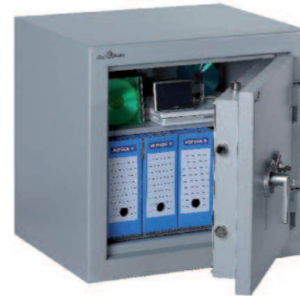
Zephir Duo 2084.