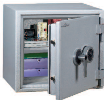
Protect Fire 50. Équipement standard, 1 tablette réglable sur crémaillères au pas de 40 mm.