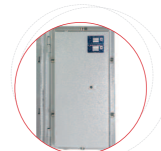
Verrouillage de la porte sur les 4 côtés par pènes tournants actifs/passifs chromés, nickelés, anti-sciage. Angle d'ouverture porte 200°.

Fabrication Nouvelles Technologies Baisse de poids de 30%