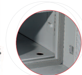
Joint multiples pour assurer l'étanchéité lors d'un incendie.