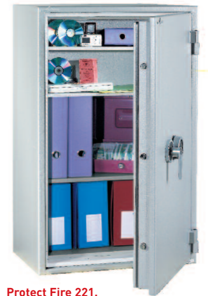
Protect Fire 221. Avec 3 tablettes réglables sur crémaillères au pas de 40 mm.

Fabrication Nouvelles Technologies Baisse de poids de 30%