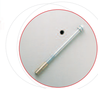
Trou de scellement à la base ø 14 mm.