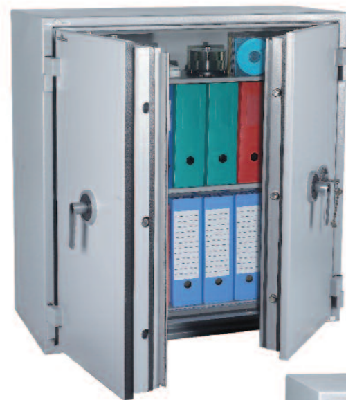
Protect Fire 246. Avec 2 tablettes réglables sur crémaillères au pas de 40 mm.