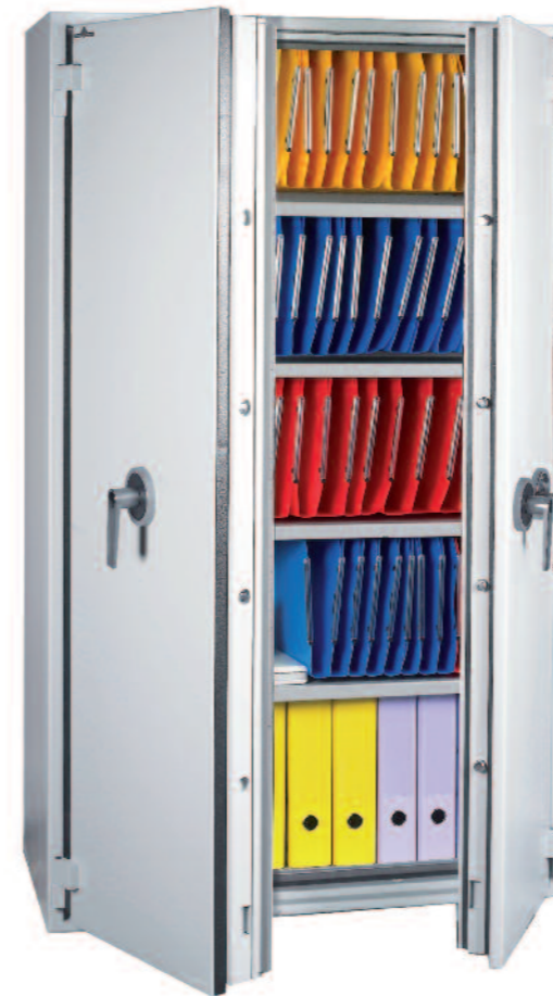
Protect Fire 710. Avec 4 tablettes pour dossiers suspendus réglables en hauteur + 1 rail d'accrochage dans le haut (5 niveaux de dossiers suspendus au total).

Les armoires ignifuges Protect Fire sont homologuées norme Européenne EN 1047.1, S60P. Détail du test page 4.